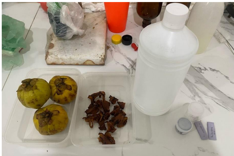
Bahan yang digunakan