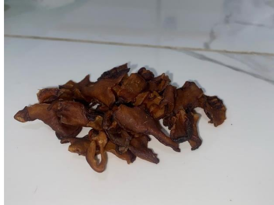
Asam Gelugur Kering