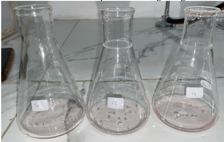
Hasil Titration Sampel Asam Gelugur Kering