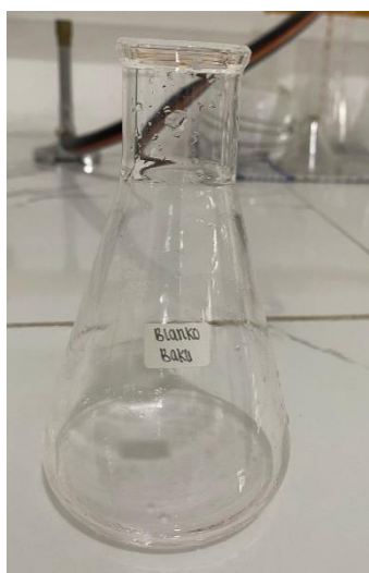
Hasil Titration Volume Blanko Baku