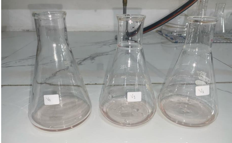
Hasil Titration Sampel Asam Gelugur Segar