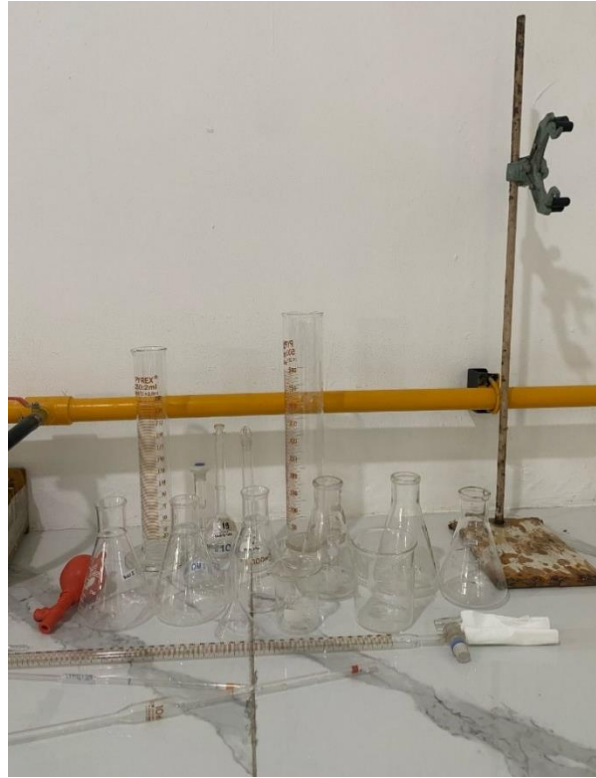
Alat yang digunakan