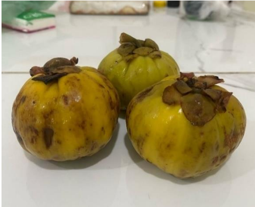
Asam Gelugur Segar