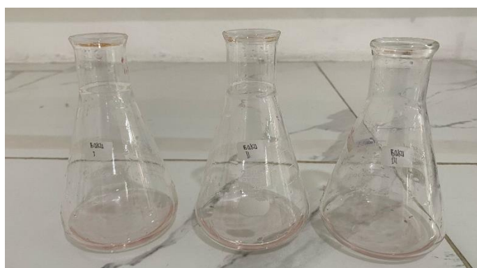
Hasil Titration Pembakuan Larutan Titer 2,6-Diklorofenol Indofenol