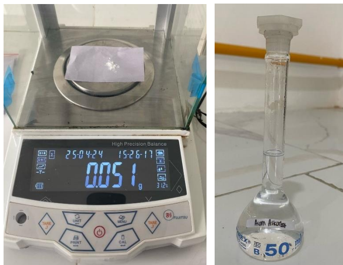
Larutan Baku Pembanding Asam Askorbat