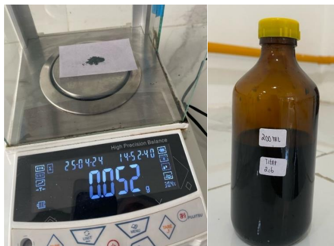
Larutan Titer 2,6-Diklorofenol Indofenol