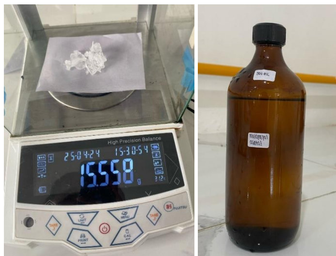
Larutan Asam Metafosfat Asetat