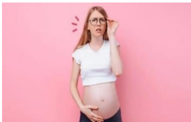
Gambar 2.3 Masalah penglihatan