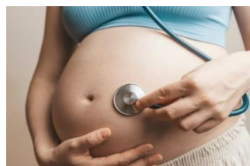
Gambar 2.6 Gerakan janin berkurang