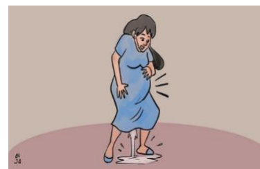
Gambar 2.8 Air ketuban keluar