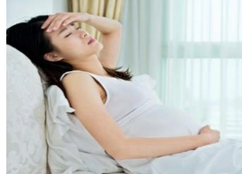
Gambar 2.2 Sakit kepala yang hebat