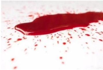
Gambar 2.1 Perdarahan pervaginam

dibiarkan, sebagian besar dapat menyebabkan kematian ibu. Berikut ini beberapa tanda bahaya pada kehamilan : Vectoronly, 2021