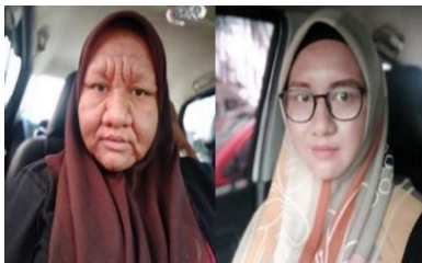
Gambar 2.5 Bengkak pada muka dan tangan