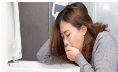
Gambar 2.7 Demam, mual muntah yang berlebihan