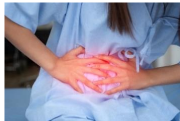
Gambar 2.4 Nyeri perut yang hebat