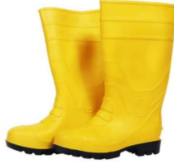
Gambar 2.7 Safety Boots

lainnya, paparan logam panas, serta zat asam. Biasanya, sepatu berbahan kulit yang berkualitas dan tahan lama dapat memberikan perlindungan yang memadai (Anizar, 2012).