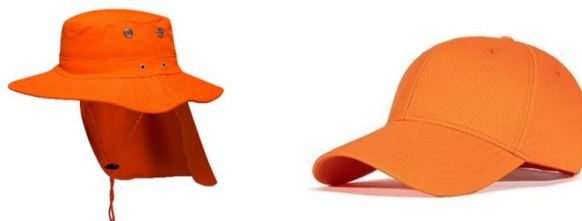
Gambar 2.1 Topi

Terdapat dua jenis alat pelindung telinga terhadap kebisingan, yaitu alat penyumbatan suara dan perlindungan telinga .: