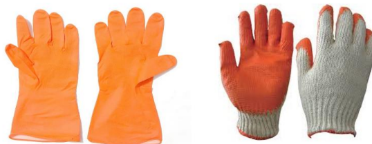
Gambar 2.6 Sarung tangan

Berdasarkan data yang ada, sekitar 20% kecelakaan kerja yang mengakibatkan cacat melibatkan cedera pada bagian tangan. Kehilangan jari atau tangan akan sangat mengganggu kemampuan kerja seseorang. Tangan merupakan organ utama yang sering langsung terpapar oleh bahan kimia berbahaya, zat toksik, material biologis, sumber listrik, serta benda dengan suhu ekstrem, baik panas maupun dingin, yang dapat menimbulkan iritasi hingga luka bakar. Selain itu, zat-zat tersebut juga berpotensi masuk ke dalam tubuh melalui kulit.