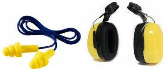
Gambar 2.2 Earplug dan Earmuff

Alat ini memiliki kemampuan untuk mereduksi tingkat kebisingan sekitar 25-40 dB pada rentang frekuensi 2000-4000 Hz, dengan syarat penutup harus dipasang dengan benar agar terhindar dari kebocoran suara serta memastikan kenyamanan saat digunakan. Namun, menemukan penutup telinga yang sesuai untuk orang Indonesia cukup menantang, meskipun alat ini dilengkapi dengan tali pengatur yang bisa diperketat atau dilonggarkan. Hal ini disebabkan oleh perbedaan bentuk dan ukuran wajah orang Indonesia dibandingkan dengan rata-rata wajah dari negara asal produk tersebut. Material yang biasa digunakan antara lain karet alami, karet sintetis, plastik lentur, serta busa uretan.