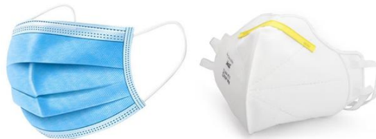
Gambar 2.4 Masker Medis dan Masker N95

Perlindungan bagi pekerja ditujukan agar mereka terlindungi dari risiko yang mengancam saluran pernapasan. Upaya ini dilakukan dengan mengendalikan polutan langsung dari sumbernya serta mencegah agar polutan tidak terhirup oleh pekerja. Pemilihan alat pelindung saluran napas harus didasarkan pada analisis bahaya yang spesifik, (Soeripto, 2008).