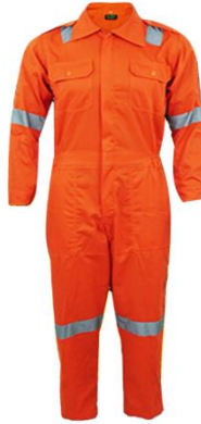
Gambar 2.5 Baju Kerja

Berdasarkan data yang ada, sekitar 20% kecelakaan kerja yang mengakibatkan cacat melibatkan cedera pada bagian tangan. Kehilangan jari atau tangan akan sangat mengganggu kemampuan kerja seseorang. Tangan merupakan organ utama yang sering langsung terpapar oleh bahan kimia berbahaya, zat toksik, material biologis, sumber listrik, serta benda dengan suhu ekstrem, baik panas maupun dingin, yang dapat menimbulkan iritasi hingga luka bakar. Selain itu, zat-zat tersebut juga berpotensi masuk ke dalam tubuh melalui kulit.