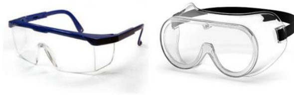
Gambar 2.3 Kacamata Pelindung

kenyamanan dalam penggunaan alat pelindung atau kondisi kerja itu sendiri.