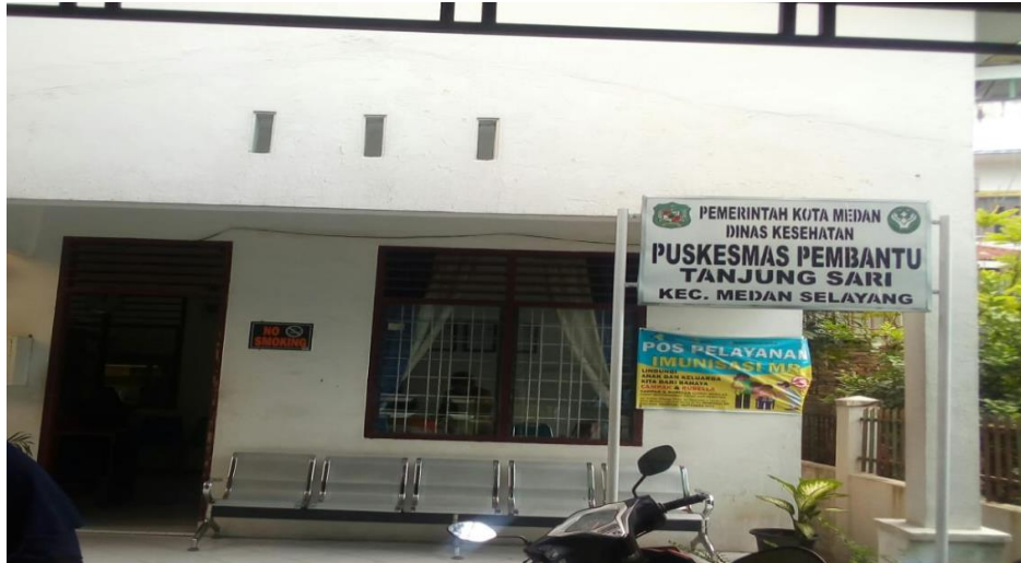
Gambar 1. Puskesmas Tanjung Sari Medan