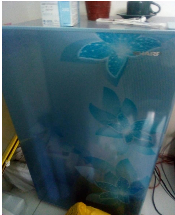
Gambar 3. Lemari Penyimpanan Vaksin