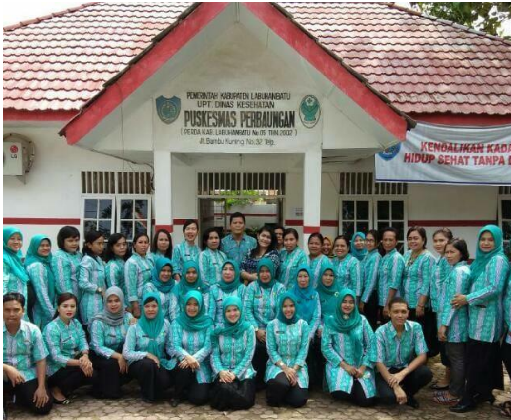
Lampiran 3 : Gambar Puskesmas Perbaungan Labuhanbatu