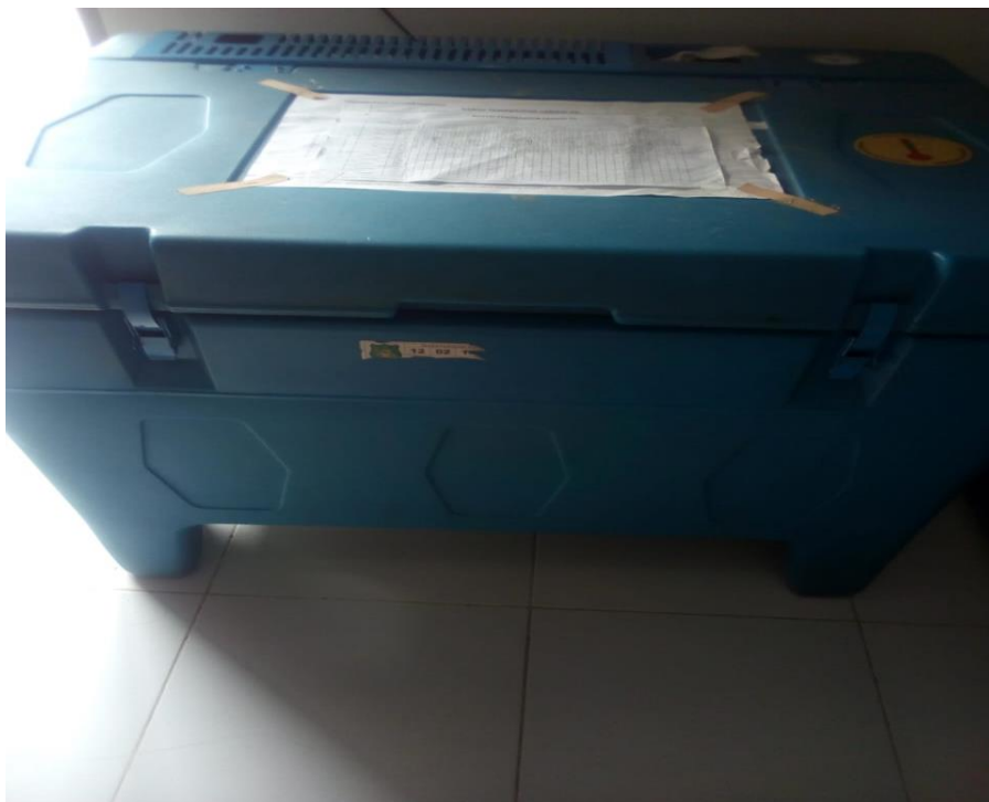
Gambar 4. Box Penyimpanan Vaksin