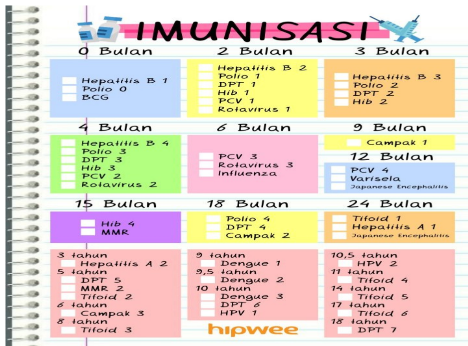
Gambar 2.1 Jadwal imunisasi

Vaksin adalah mikroorganisasi yang telah dilemahkan yang dimasukkan ke dalam tubuh agar merangsang pembentukan zat antibodi. Vaksin yang dimasukkan ke dalam tubuh melalui suntikan seperti vaksin BCG, DPT, Campak dan Hepatitis B atau melalui oral seperti vaksin Polio.