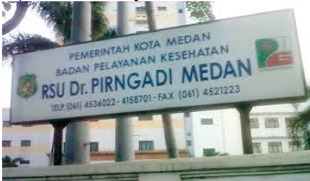
Lampiran 1. Foto RSUD Dr. Pirngadi Kota Medan