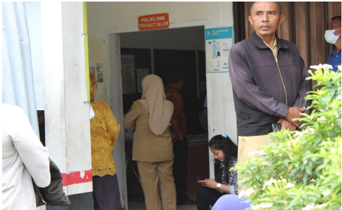
Poli Penyakit Dalam