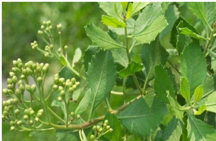
Gambar 2.1 Tanaman Beluntas ( Pluchea Indica L. )

Beluntas merupakan tumbuhan semak yang bercabang banyak. Tingginya bisa mencapai 3 meter. Beluntas dapat tumbuh di daerah kering pada tanah yang keras dan berbatu, pada daerah dataran rendah hingga dataran tinggi pada ketinggian 1000 m dari permukaan laut. Daun beluntas bertangkai pendek, berselang-seling, berbentuk bulat telur ujung bundar melancip. Tepi daun bergerigi, berwarna hijau terang, bunga keluar di ujung cabang dan ketiak daun, berbentuk bunga bonggol, bergagang atau duduk, dan berwarna ungu. Buahnya berbentuk seperti gangsing, berwarna coklat dengan bersudut putih. (Winkanda Satria Putra )