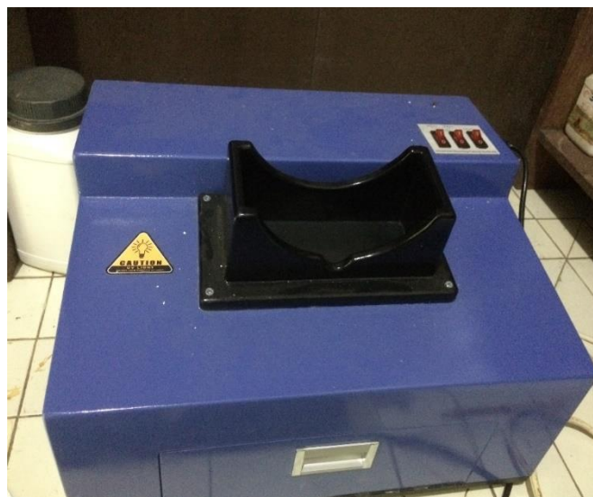
Lampu UV 254 nm dan 365 nm