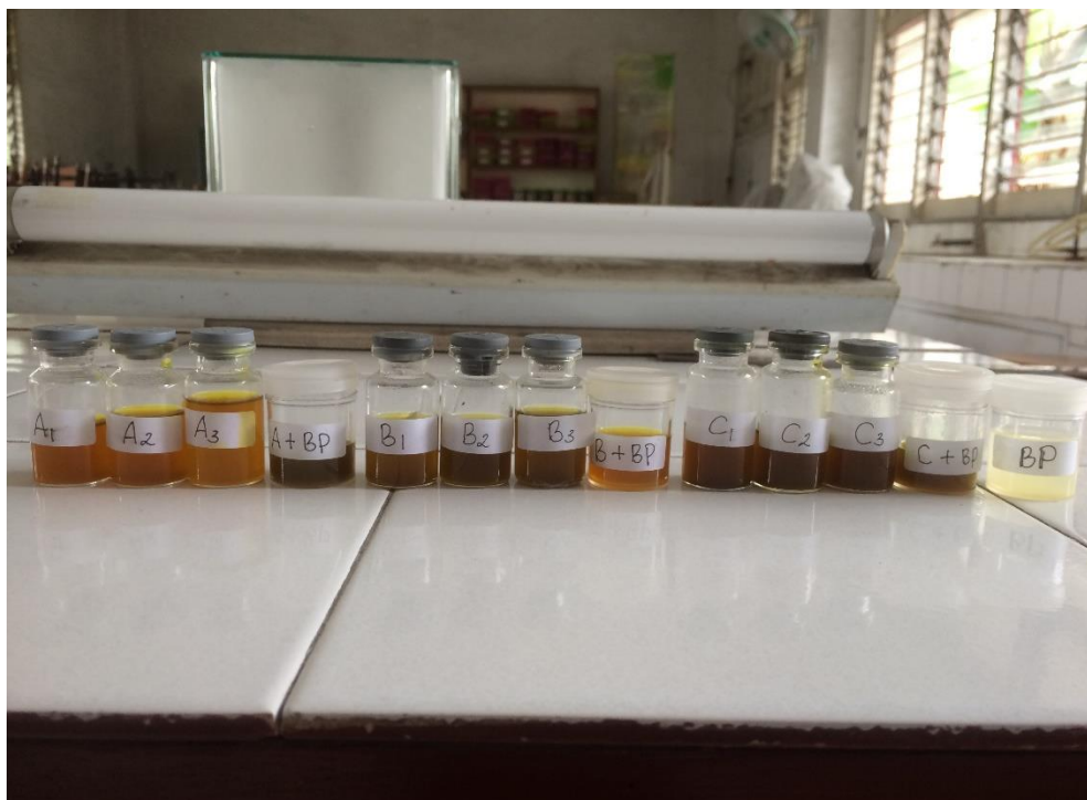
Sampel Yang Sudah Diekstrak