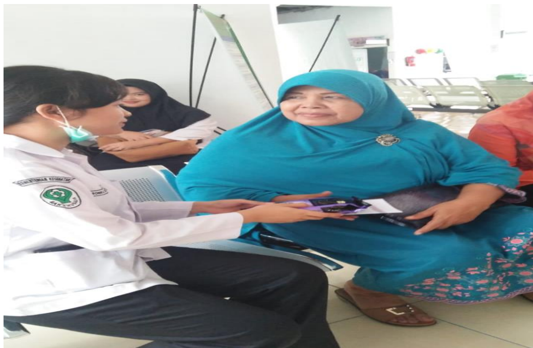
Foto Peneliti saat memberikan brosur dan gift kepada pasien