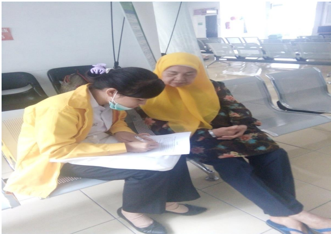
Foto Peneliti saat membantu pasien mengisi kuesioner