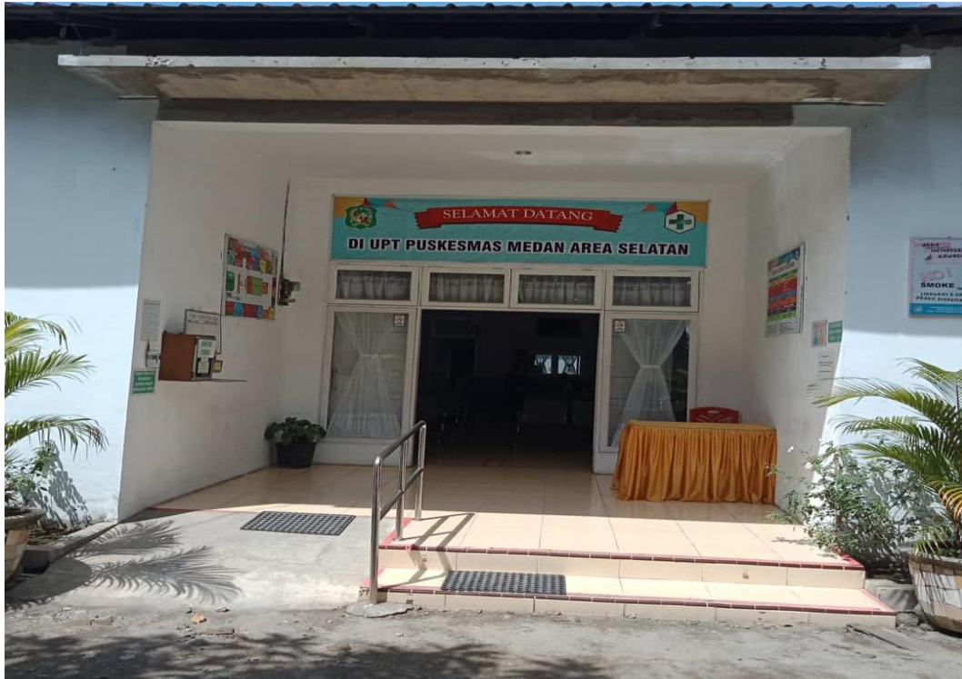
Foto lokasi penelitian di Puskesmas Medan Area Selatan Kota Medan