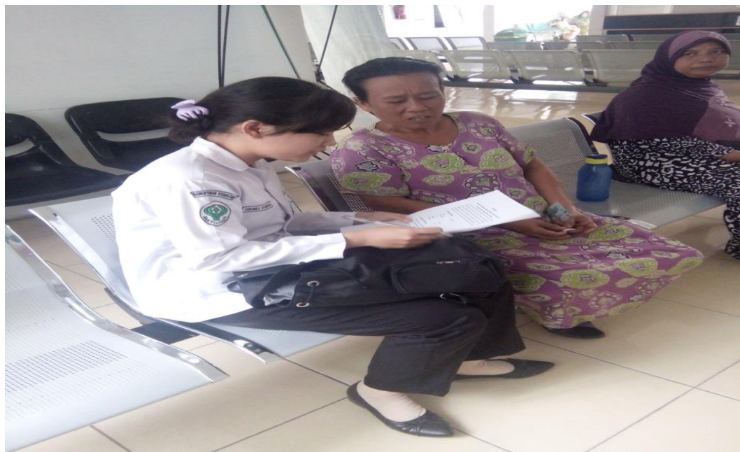
Foto Peneliti saat memberi penjelasan kepada responden dalam pengisian kuesioner