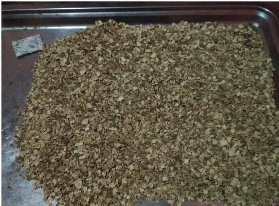
Gambar 2. Kulit Buah Jeruk Nipis yang Sudah Dikeringkan