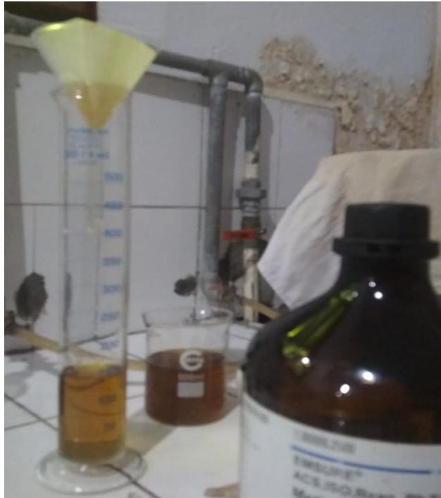
Gambar 3. Proses Penyaringan Setelah Maserasi