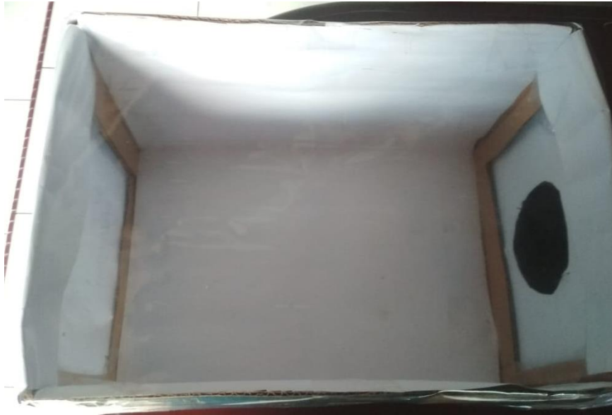
Gambar 9. Kotak Nyamuk dan Kotak Pengujian