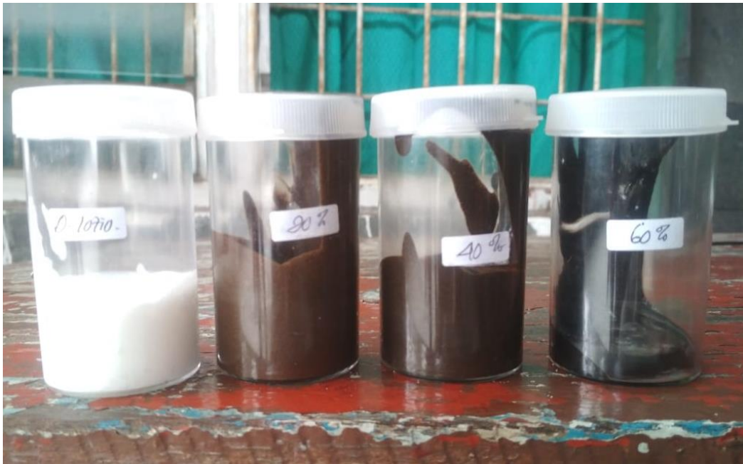
Gambar 5. Bahan Uji