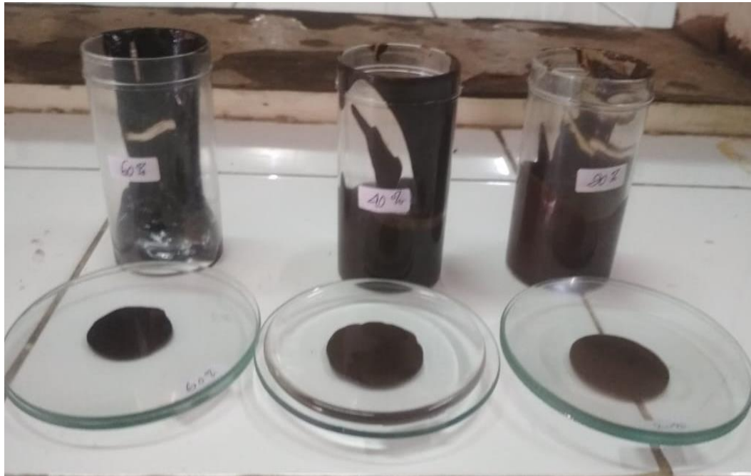
Gambar 8. Uji Daya Sebar Lotion