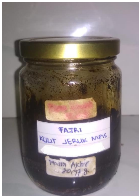
Gambar 4. Hasil Ekstrak Kental