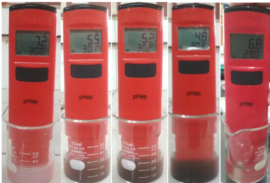
Gambar 7. Uji pH Lotion