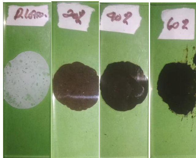
Gambar 6. Uji Homogenitas Lotion