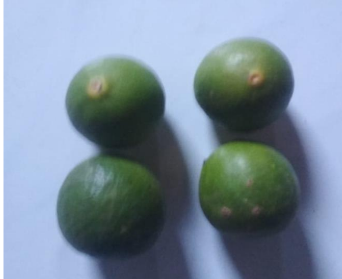
Gambar 1. Buah Jeruk Nipis