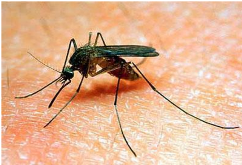
Gambar 10. Nyamuk Culex Sp Dewasa