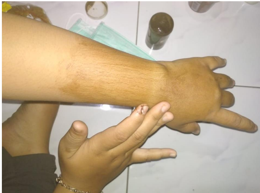
Gambar 11. Mengoleskan Bahan Uji Terhadap tangan Sukarelawan