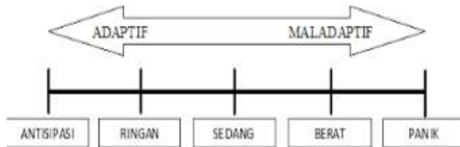
Gambar 2.3.4 Rentang Kecemasan