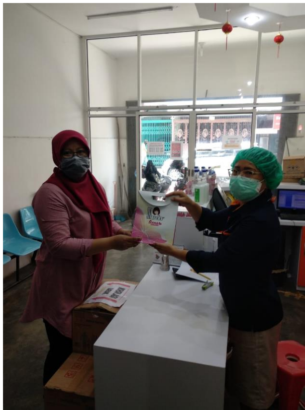
Gambar 3. Pengambilan Kuisisioner