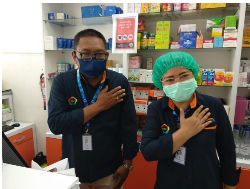
Gambar 2. Profil Apotek