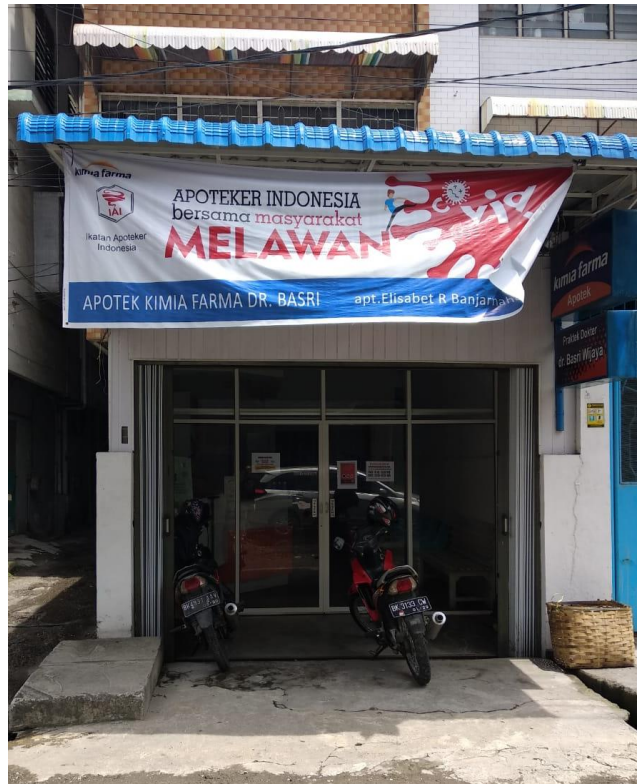
Gambar 1. Apotek Kimia Farma Basri Medan