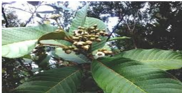
Gambar 2.1 Pirdot ( Saurauia vulcani Korth)