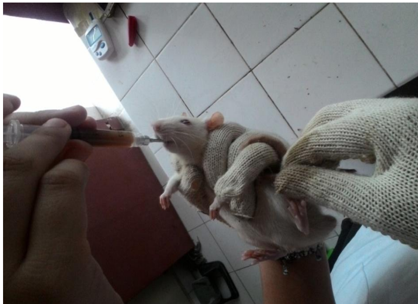
Gambar.6 Pemberian Obat secara Oral