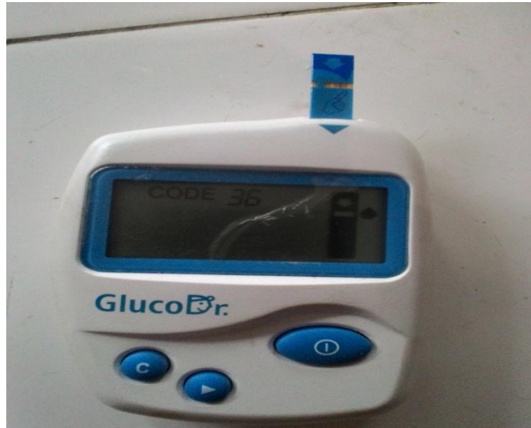
Gambar.7 Alat Glukometer