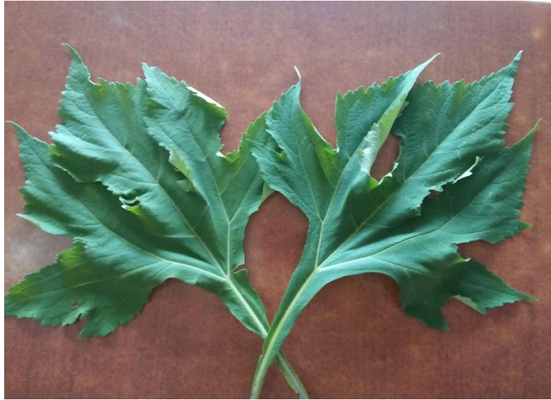
Gambar.1 Daun Kembang Bulan Segar