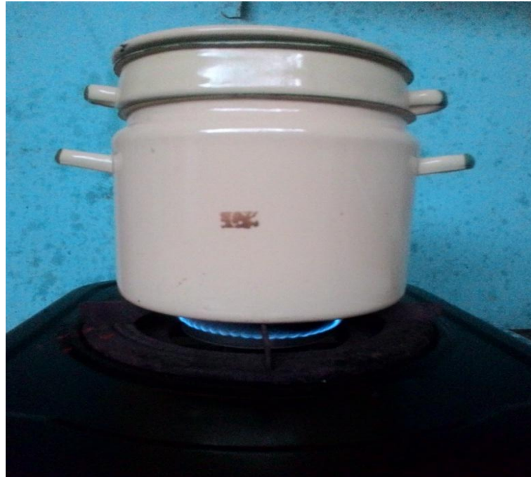
Gambar.3 Pembuatan Infusa Daun Kembang Bulan