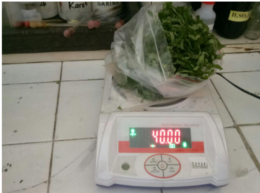
Gambar.2 Penimbangan Daun Kembang Bulan