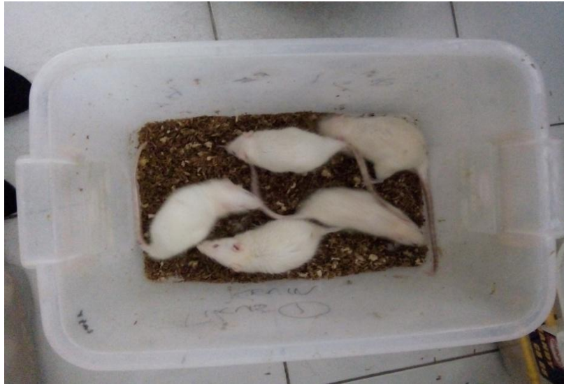
Gambar.5 Tikus Putih