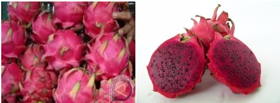
Gambar 2.1 Buah naga daging supermerah ( Hylocereus lemairei (Hook.) Britton & Rose)

Sistematika buah naga daging supermerah sebagai berikut: