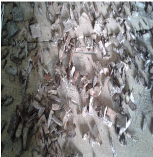
Gambar 3. Proses pengeringan bonggol pisang