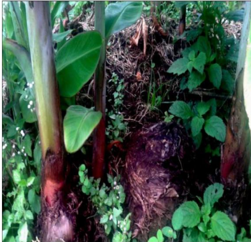
Gambar 1. Bonggol pisang gambon