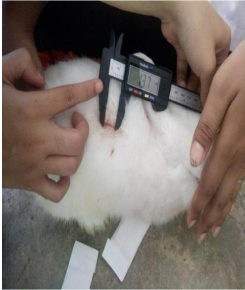
Gambar 16. Pengamatan luka kelinci