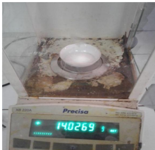
Gambar 9. Penimbangan bahan