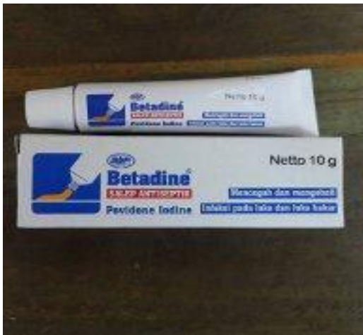
Gambar 13. Betadinkrim