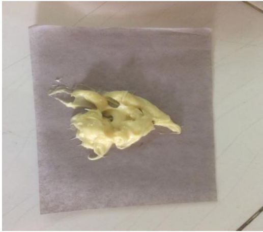
Gambar 7. Adeps Lanae