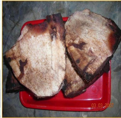
Gambar 2. Bonggol pisang gambon yang telah dibersihkan.