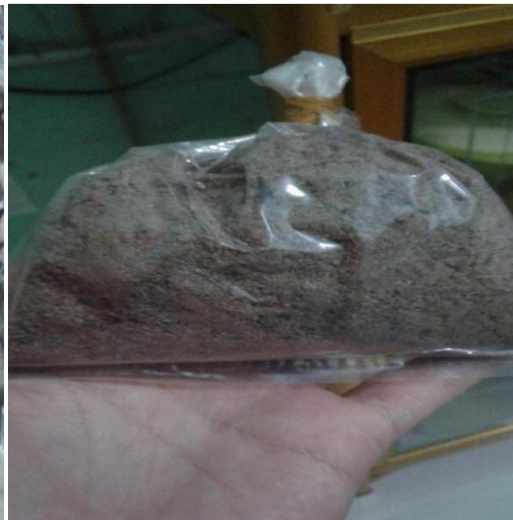
Gambar 4. Serbuk bonggol pisang