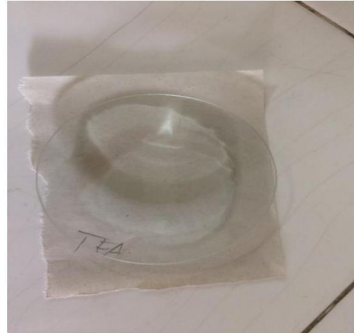
Gambar 6. Triethanolamin