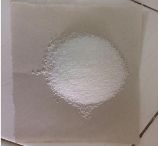
Gambar 5. Asam Stearat