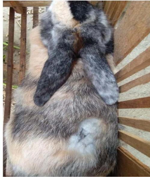
Gambar 17. Luka kelinci yang sudah sembuh