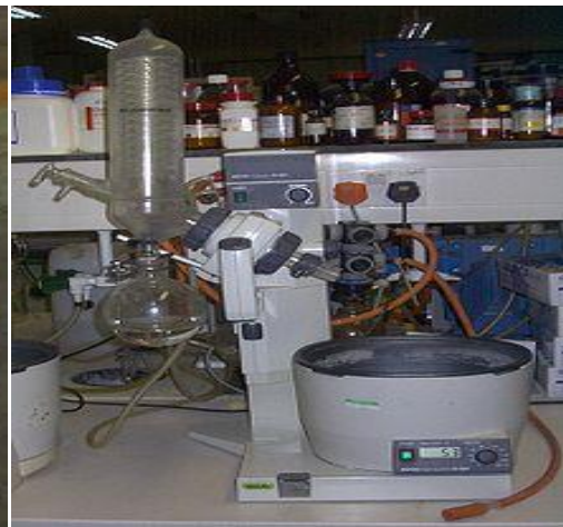
Gambar 14. Alat rotary evaporator