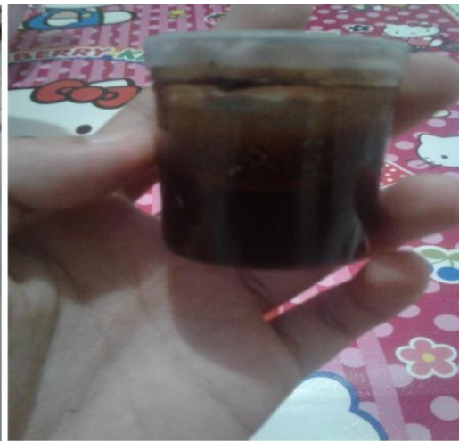
Gambar 12. Krim ekstrak bonggol pisang ambon tiga konsentrasi