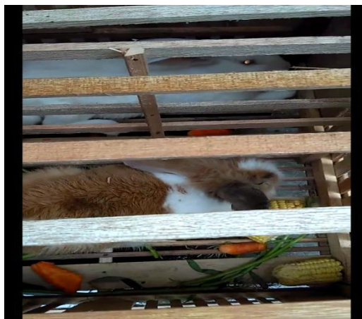
Gambar 15. Adaptasi kelinci