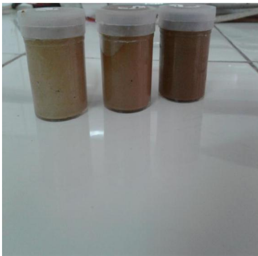
Gambar 11. Ekstrak kental bonggol pisang ambon