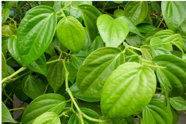
Gambar 2.1 Daun Sirih

Sirih merupakan tanaman yang tumbuh merambat atau menjalar menyerupai tanaman lada. Tinggi rambatan bisa mencapai 15 m, tergantung pada kesuburan media tanam dan media untuk merambat. Batang sirih berwarna coklat kehijauan, berbentuk bulat dan beruas yang merupakan tempat keluarnya akar. Morfologi daun sirih berbentuk jantung, berujung runcing, tumbuh berselang-seling, bertangkai, teksturnya agak kasar jika diraba dan mengeluarkan bau khas aromatik jika diremas. Panjang daun 6 - 17,5 cm dan lebar 3,5 - 10 cm. Sirih memiliki bunga majemuk yang berbentuk bulir dan merunduk. Bunga sirih dilindungi oleh daun pelindung yang berbentuk bulat panjang dengan diameter 1 mm. Buah terletak tersembunyi atau buni, berbentuk bulat, berdaging dan berwarna kuning kehijauan hingga hijau keabu-abuan. Tanaman sirih memiliki akar tunggang yang berbentuk bulat dan berwarna coklat kekuningan (Sheilla, 2012)