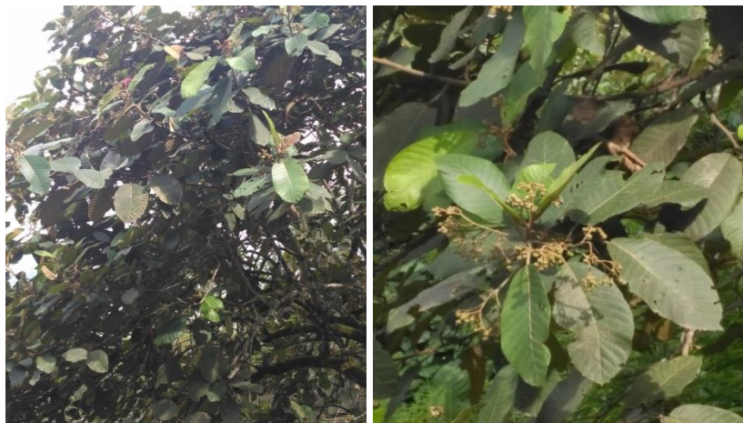
Gambar 2.1 Pirdot ( Saurauia vulcani Korth)

Kingdom : Plantae Devisio : Spermatophyta Subdivisio : Angiospermae Class : Dicotyledoneae Ordo : Ericales Familia : Ericaceae Genus : Saurauia Species : Saurauia vulcani Korth