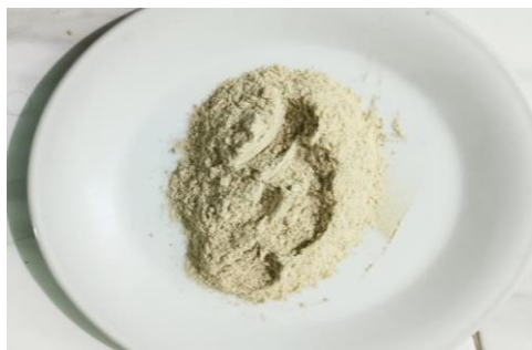
Gambar 2. Tepung Ikan Kresek