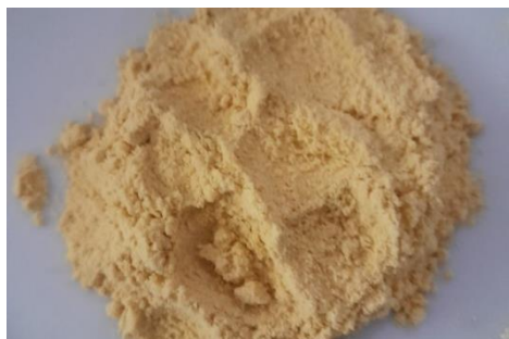
Gambar 4. Tepung Jagung