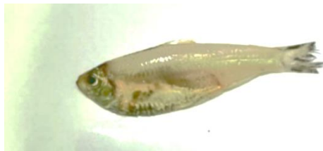
Gambar 1. Ikan Kresek

Ikan kresek ( Thryssa mystax ) merupakan salah satu jenis ikan laut yang dapat dikonsumsi dalam bentuk segar, asin, kering, dan juga sebagai bahan dasar terasi ikan (Direktorat Jenderal Perikanan, 1997). Di daerah pesisir pantai jenis ikan ini banyak dimanfaatkan sebagai ikan asin. Ikan ini tergolong jenis ikan pelagis atau ikan kecil yang hidup berkelompok.