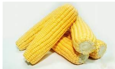
Gambar 3. Jagung Kuning

Jagung ( Zea mays, L. ) adalah tanaman serealia yang termasuk dalam keluarga Poaceae dan ordo Poales . Tanaman ini bersifat berumah satu ( monoecious ), di mana bunga jantan dan bunga betina terpisah tetapi masih tumbuh dalam satu tanaman. Jagung memiliki sifat protandrus, yang berarti bunga jantan mekar dan melepaskan tepung sari sekitar satu atau dua hari sebelum bunga betina muncul (Suleman et al. , 2019).