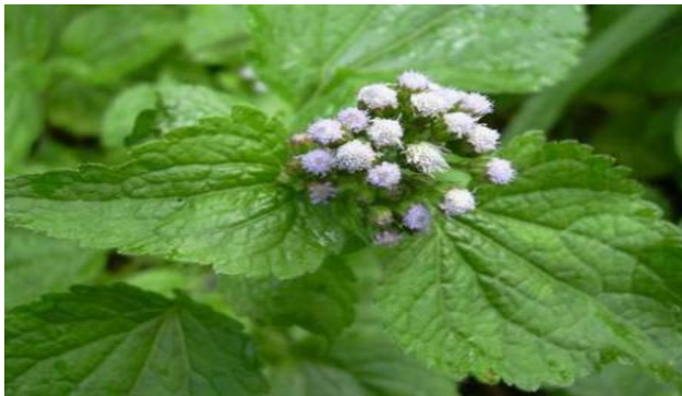
Gambar 2.1. Daun Bandotan ( Ageratum conyzoides L)