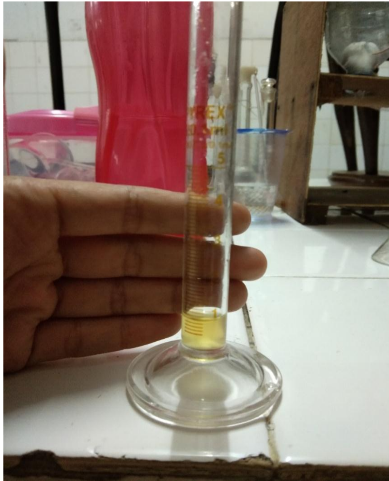
Gambar 11. Volume Urine Tertampung (VUT).