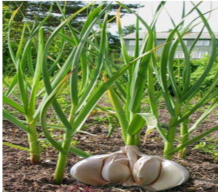
Gambar 1. Tumbuhan Bawang Putih ( Allium sativum L.)