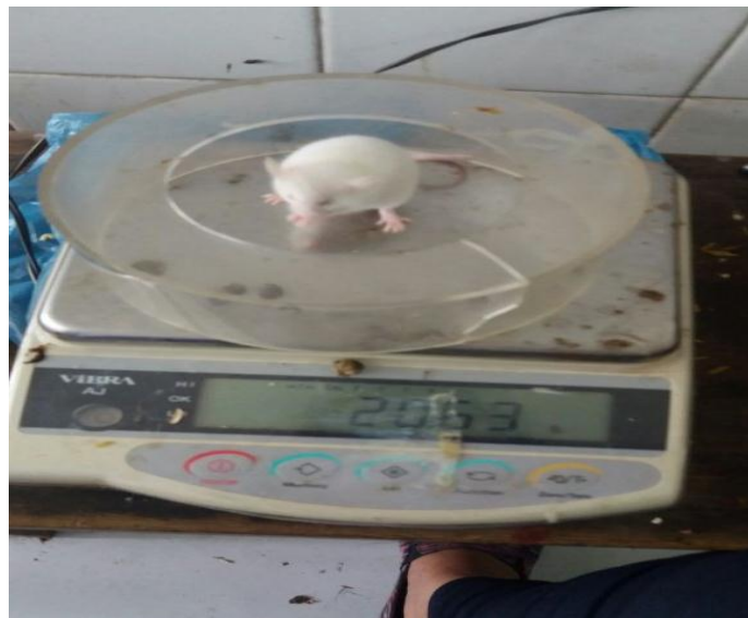
Gambar 4. Penimbangan Berat Badan Mencit ( Mus musculus ).