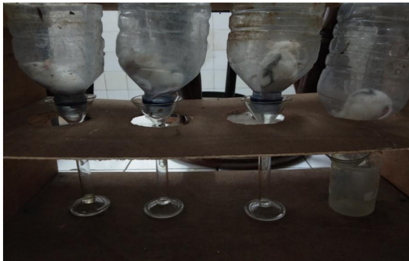
Gambar 10. Alat Penampung Urin Mencit.