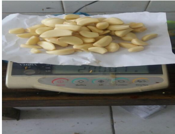
Gambar 3. Penimbangan Bawang Putih ( Allium sativum L.)