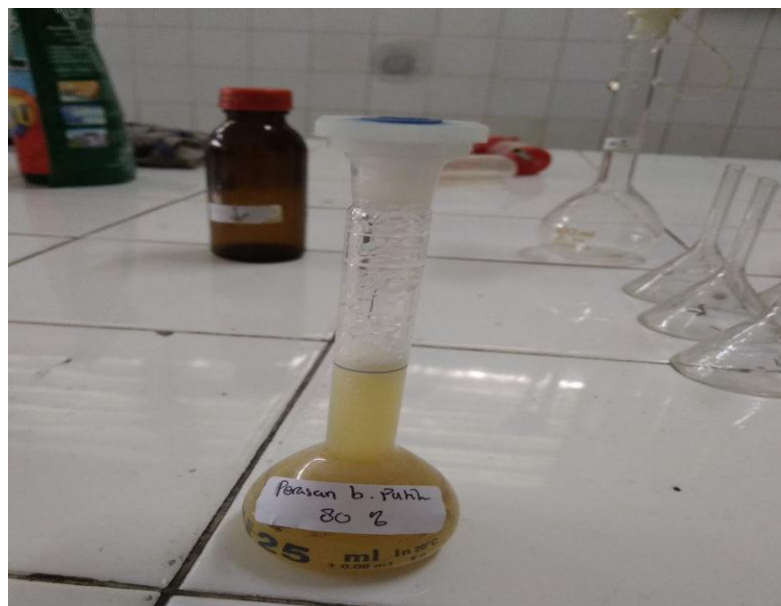
Gambar 6. Perasan Bawang Putih 80%.