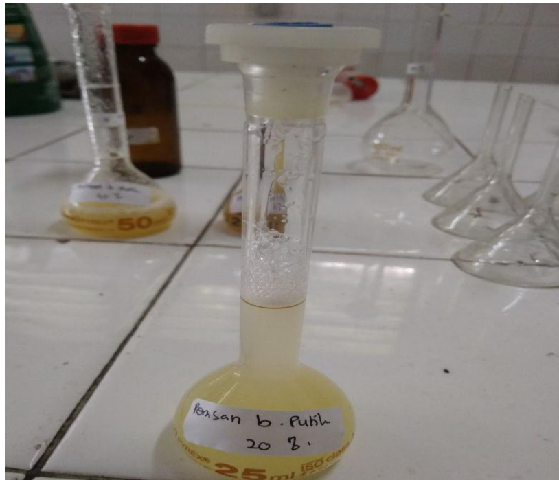
Gambar 8. Perasan Bawang Putih 20%.