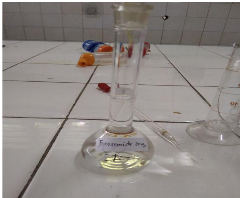
Gambar 5. Larutan Furosemida.