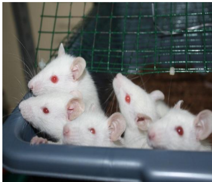
Gambar 2. Mencit ( Mus musculus )