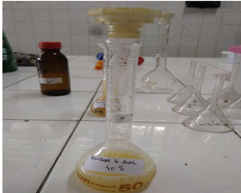
Gambar 7. Perasan Bawang Putih 40%.