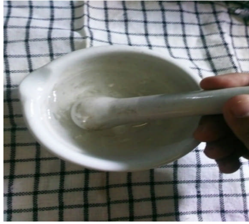
Gambar 5. Suspensi CMC 0,5%