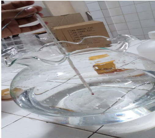
Gambar 10. Pengukuran Suhu Air