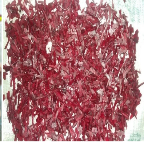
Gambar 2. Simplisia Umbi Bit