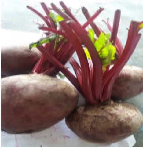
Gambar 1. Umbi Bit Segar