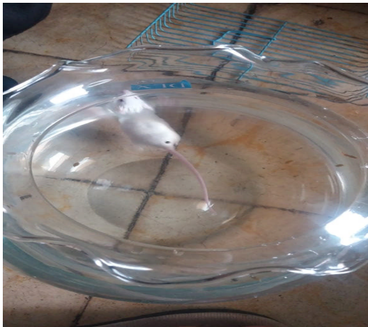
Gambar 12. Mencit Diberenangkan