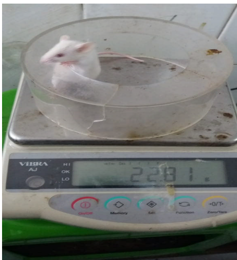
Gambar 8. Mencit yang ditimbang