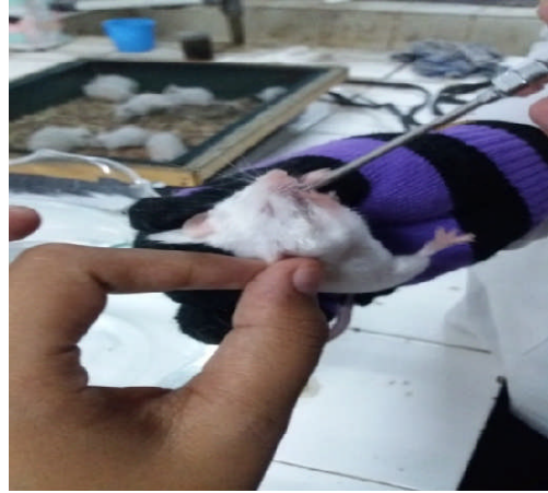
Gambar 11. Pemberian obat secara oral