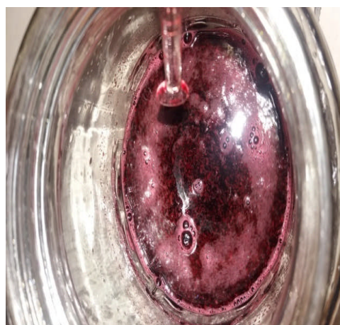
Gambar 3. Ekstrak Umbi Bit