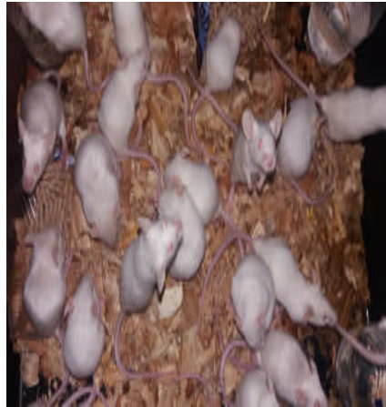
Gambar 7. Hewan Percobaan