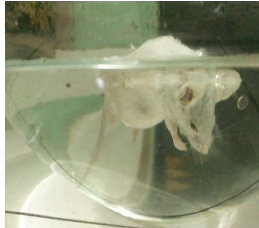
Gambar 13. Mencit Menunjukkan kelelahan