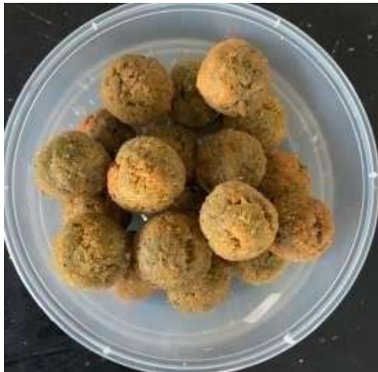
Gambar 9. Bola Ikan Kedukang dan Daun Katuk (300 gr)