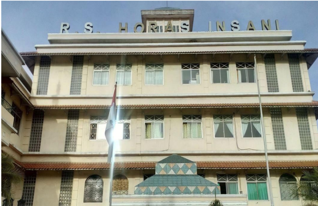
Foto rumah sakit Horas Insani Kota Pematangsiantar