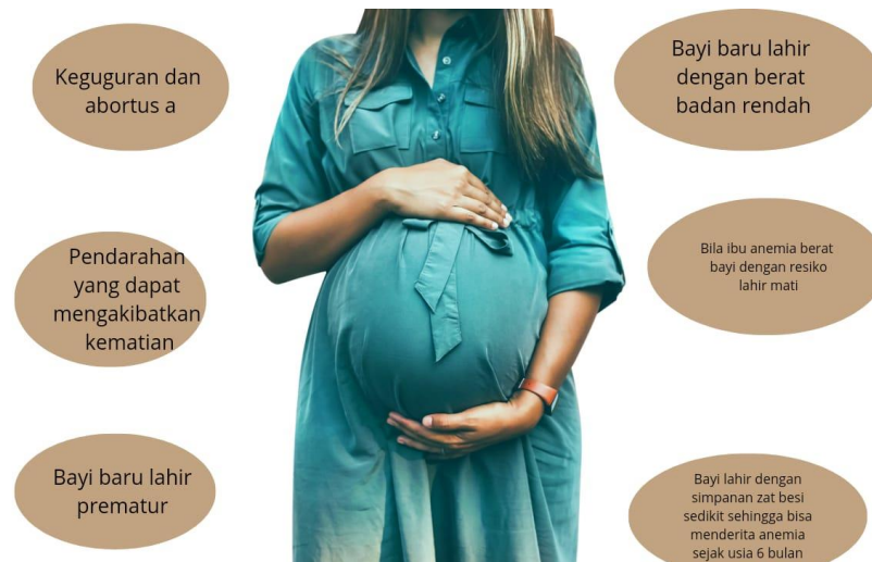
Gambar 2.2 Resiko Ibu Hamil Anemia

Penyebab anemia pada remaja antara lain: