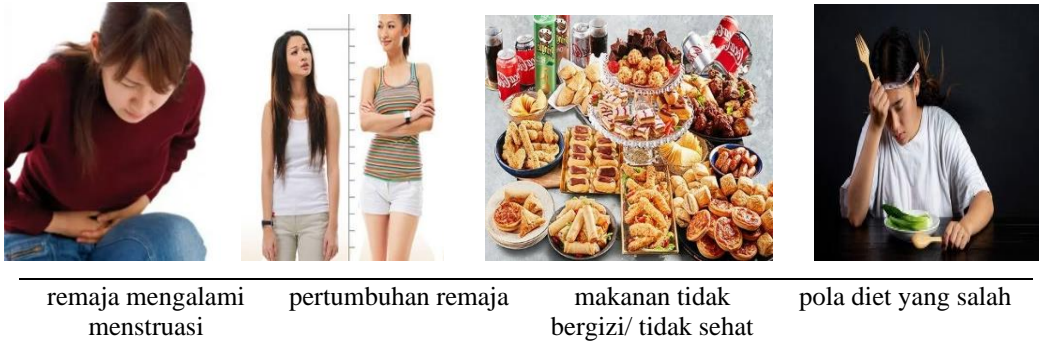
Gambar 2.3 Pola Hidup Remaja