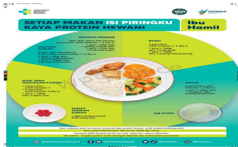
Gambar 2.1 Menu Makanan Bergizi