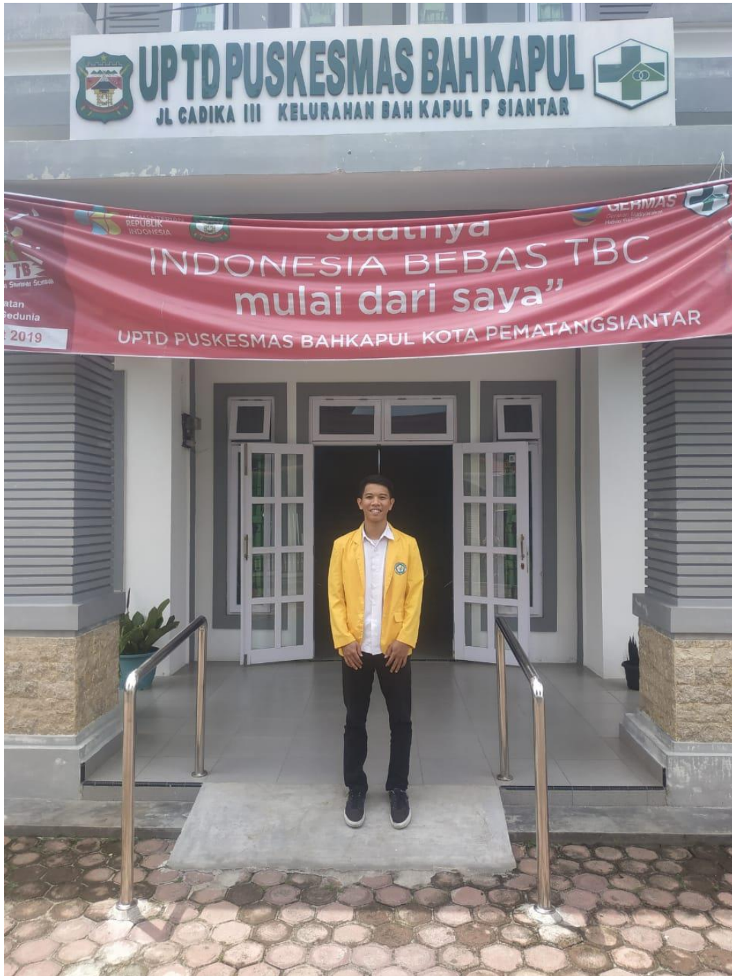
Lampiran 6 gambar