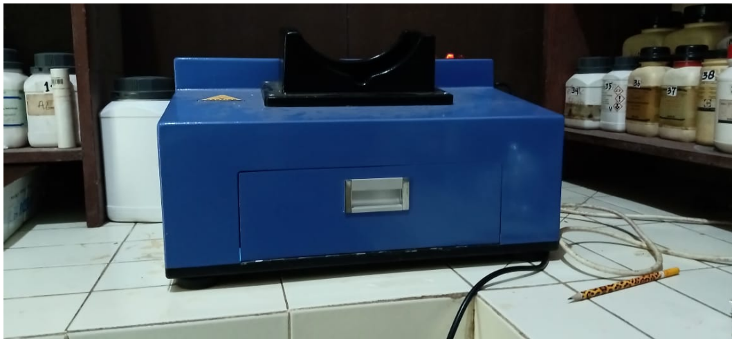
Gambar 4. UV Viewing Cabinet