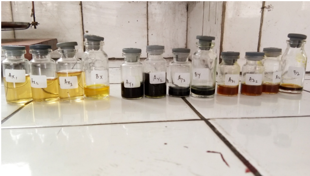
Gambar 3. Larutan Uji A, B dan C