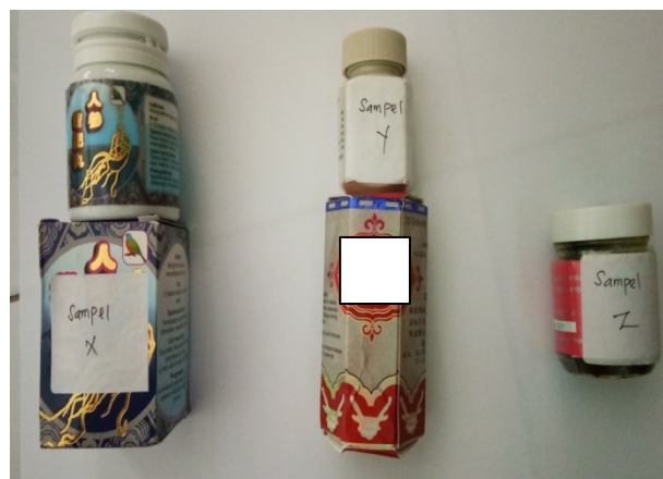
Gambar 2. Sampel