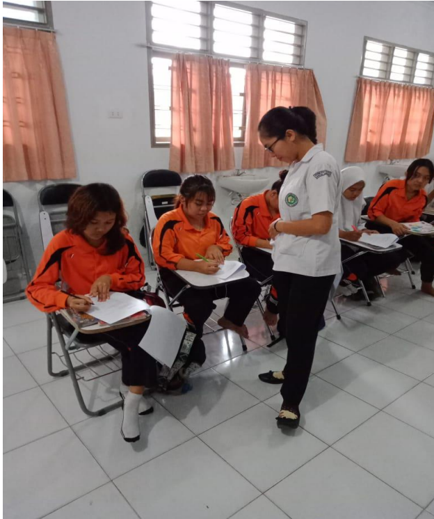
Dokumentasi 3. Foto Siswi Kelas XI Jurusan Tata Kecantikan SMK Negeri 10 Medan Sedang Mengisi Kuesioner