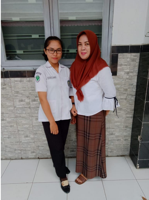
Dokumentasi 1. Foto bersama Kepala Jurusan Tata Kecantikan SMK Negeri 10 Medan