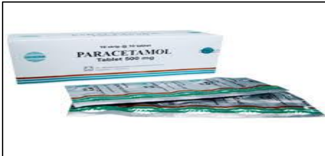
Gambar1. Tablet Paracetamol