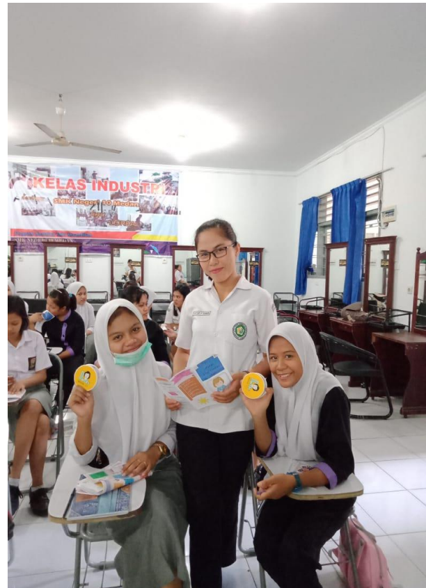
Dokumentasi 4. Foto Siswi Kelas XI Jurusan Tata Kecantikan SMK Negeri 10 Medan Sedang Membaca Brosur