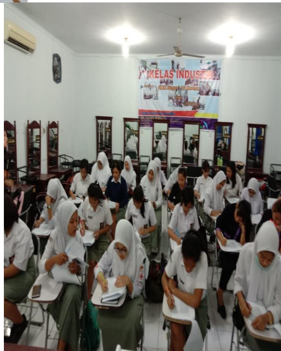
Dokumentasi 2. Foto Siswi Kelas XI Jurusan Tata Kecantikan SMK Negeri 10 Medan