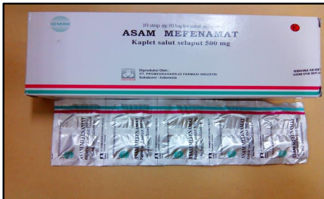
Gambar 2 Tablet AsamMefenamat