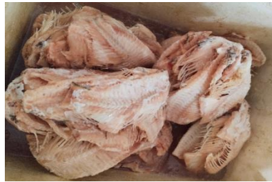
Gambar 1. Tulang Ikan Nila

ditemukan dalam jumlah besar pada tulang ikan, terutama dalam bentuk kalsium fosfat yang mencapai 14 persen dari total komposisi tulang. Kalsium fosfat yang kompleks ini terdapat di dalam tulang dan dapat diserap dengan baik oleh tubuh, sekitar 60 hingga 70 persen. Kalsium memiliki berbagai manfaat, termasuk membantu dalam pembentukan dan pemeliharaan tulang serta gigi. Mineral ini penting untuk proses pembentukan dan perawatan kerangka tubuh, juga beberapa fungsi penting lainnya seperti pembekuan darah, kontraksi otot, menjaga keseimbangan hormon, serta bertindak sebagai katalis dalam reaksi biologis. Salah satu akibat yang sering muncul akibat kurangnya kalsium adalah osteoporosis, yang kini menjadi masalah umum.