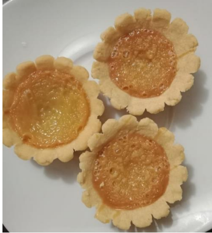
Gambar 2. Pie Susu