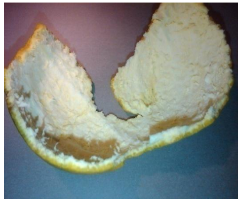
Gambar 2.2 Kulit Buah Jeruk Manis

Tanaman jeruk manis dapat tumbuh pada berbagai ketinggian, mulai dari dataran rendah sampai dataran tinggi, tergantung varietasnya. Tanaman jeruk manis dapat tumbuh pada tempat yang ketinggiannya 1-4000 meter dari permukaan laut. Jeruk manis tumbuh baik pada daerah kering dengan iklim basah sampai agak kering. Jeruk manis memiliki ciri tangkai daun yang