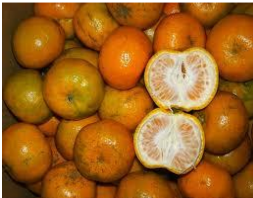
Gambar 2.1 Buah Jeruk Manis