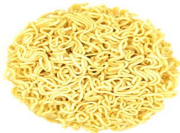
Gambar 3. Mie Kering

Rasa, tekstur, elastisitas, dan kemampuan mengikat air pada mie semua meningkat dengan tambahan garam meja (Astawan, 2006).