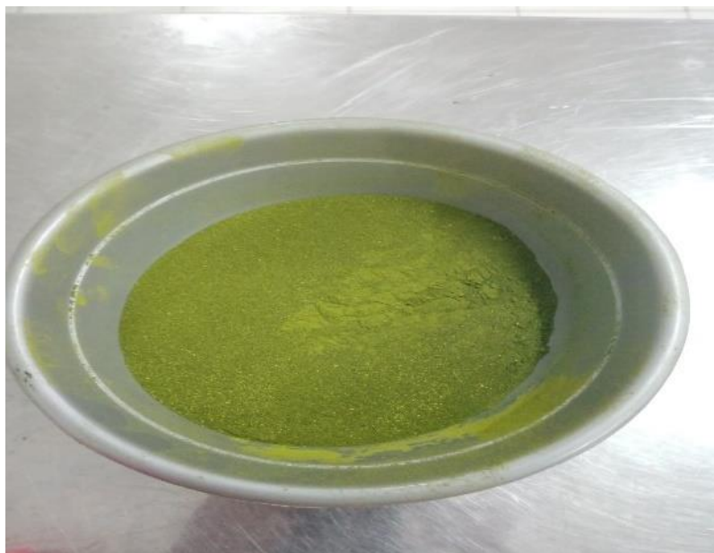
Gambar 2. Tepung Daun Brokoli

Selain itu, penggunaan tepung daun brokoli menambah sifat anti penuaan dan antioksidan pada roti bebas gluten. (Krupa-Kozak et al., 2019) menyelidiki efek penambahan tepung daun brokoli ke kue bolu bebas gluten dan menemukan bahwa dengan menambahkan 2,5% bubuk daun brokoli untuk menggantikan pati telah meningkatkan aktivitas antioksidan kue bolu bebas gluten yang baru. (Drabińska et al., 2022) menemukan bahwa waktu memasak optimal dan penyerapan air menjadi lebih singkat ketika 5% tepung daun brokoli ditambahkan ke pasta gandum durum, tepung daun brokoli meningkatkan kandungan mineral dan protein pasta tanpa mengubah evaluasi sensorik.