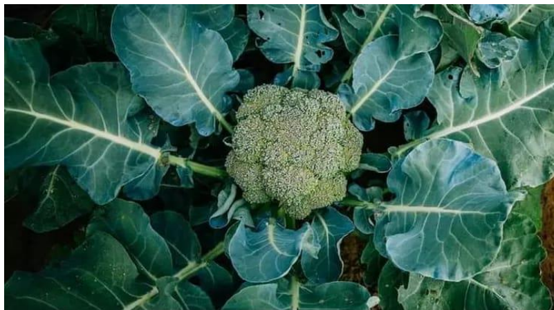
Gambar 1. Daun Brokoli

Daun brokoli merupakan bagian dari tanaman brokoli. Daun brokoli agak keras dan berlapis lilin, dan tumbuh berselang-seling di batang tanaman. Daunnya berbentuk bulat (oval) seperti telur, bergerigi pada bagian tepinya, berwarna hijau, dan daun terdalamnya yang kecil melindungi bunga baru yang terbentuk dari sinar matahari. Meskipun daun brokoli jarang digunakan sebagai konsumsi masyarakat, beberapa penelitian melaporkan bahwa sama dengan bagian yang dapat dimakan, daun brokoli adalah sumber yang sangat kaya akan senyawa bioaktif (glukosinolat dan polifenol) dan nutrisi penting lainnya, seperti vitamin E dan K (Drabińska et al., 2022).