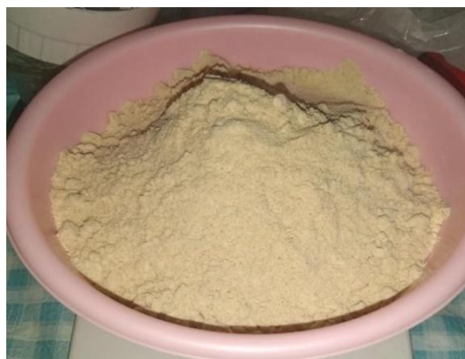
Gambar 3. Tepung Forte

Forte merupakan tepung formula yang berbahan dasar tempe, tepung gula, tepung terigu, dan ovalet kemudian dikeringkan pada cabinet dryer dengan suhu 60°C.