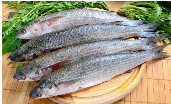
Gambar 1. Ikan Belanak ( Mugil cephalus )

Ikan belanak hidup diperairan asin, payau, dan tawar. Ikan ini berasal dari genus Mugil yang memiliki kemampuan beradaptasi yang luar biasa. Bentuk ikan ini pipih memanjang, memiliki keunikan, lebih tebalnya bibir atas dibandingkan dengan bibir bawah (Ratnaningsih dkk., 2022).