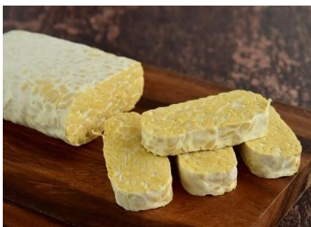
Gambar 2. Tempe

Tempe merupakan bahan pangan fungsional yang sering dikonsumsi oleh masyarakat dan sering dijumpai di pasar serta harga yang relatif murah dan terjangkau. Tempe dihasilkan melalui proses fermentasi kapang Rhizopus sp. Kandungan asam amino dalam tinggi lebih tinggi dibanding dengan susu kedelai. Tempe memiliki banyak manfaat bagi pencernaan, pernapasan, dan peredaran darah. Tempe mengandung asam lemak tak jenuh (PUFA) dan senyawa flavonoid sebagai antioksidan, anti inflamasi, dan anti karsinogenik (Rahmi dkk., 2018).