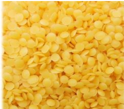
Gambar 2.1 Lilin Lebah

Lilin lebah adalah wax alami yang merupakan hasil sampingan dari pembuatan madu dengan perbandingan hasil madu : wax = 10 : 1. Minyak lebah dihasilkan dari lebah betina pada temperatur 33°C sampai 36°C untuk membentuk sarang lebah.