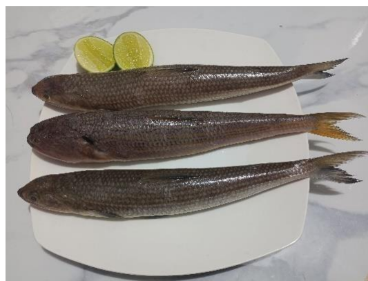
Gambar 2. Ikan Belanak