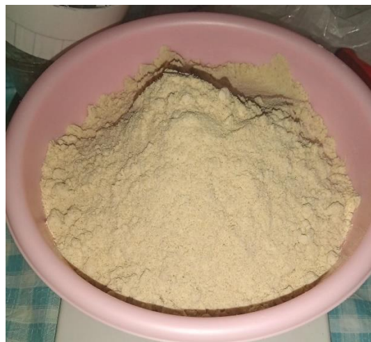
Gambar 4. Forte

Forte adalah formula yang terbuat dari tempe, tepung gula, tepung terigu yang dikeringkan di cabinet dryer pada suhu 60°C.