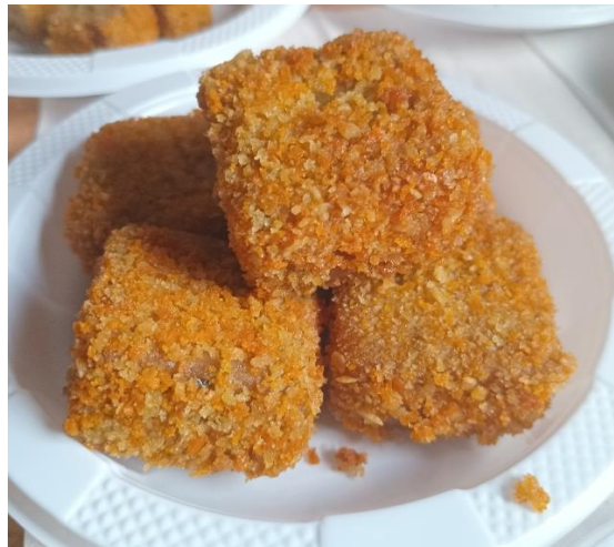
Gambar 1. Nugget

Pengolahan nugget yang mudah menjadi salah satu solusi ketika merasa bosan dengan tampilan menu makanan. Nugget ikan banyak disukai masyarakat sebagai makanan selingan. Adanya modifikasi makanan menarik perhatian masyarakat untuk meningkatkan konsumsi makanan yang sesuai dengan kebutuhan gizi (Aisyah et al., 2020).