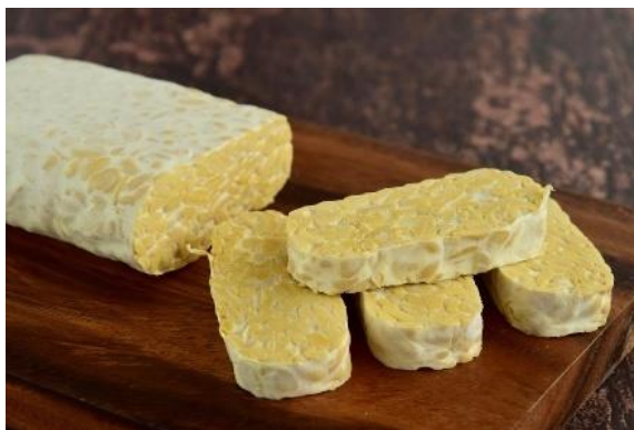
Gambar 3. Tempe